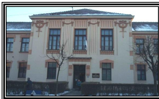
ОШ "Емилија Остојић" Пожега